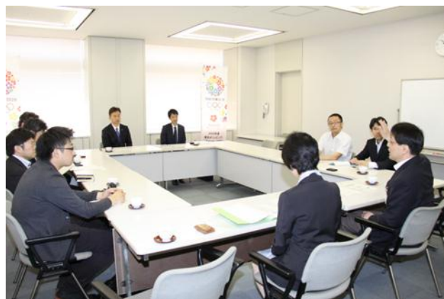
【環境への取組みに関する説明会】

贈呈式当日は、緑の東京募金のご担当者様のほか、経済産業省のご担当者様も出席され、当社のどんぐりポイント制度への参加をはじめとする環境保全に関する取組みに対し、高い評価を頂きました。